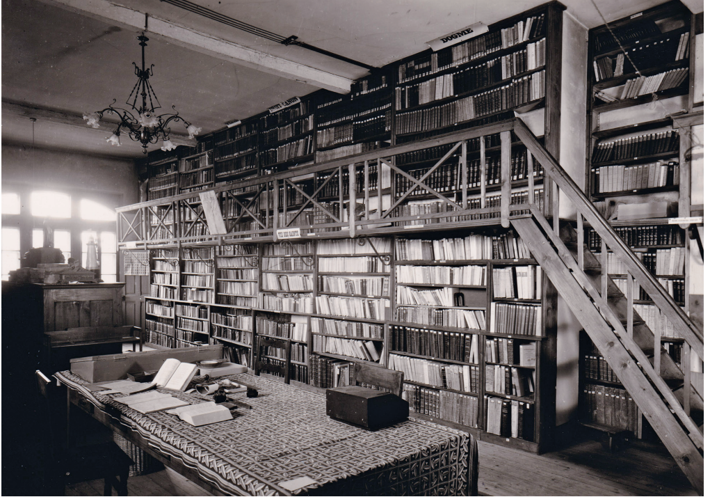
Abb. 2: Die Bibliothek des Kapuzinerkonvents Romont.

Nr. 267 eine sorgfältige Studie 19 . In diesem umfassenden Verzeichnis, das 370 Nummern zählt, beschreibt Meyer das Missale minutiös und gibt Auskunft über die Anzahl der Blätter, berichtet aber auch, es enthalte die meisten der im Rosenthal-Exemplar fehlenden Blätter und erwähnt weiter typografische und paginatorische